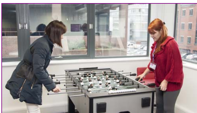
Sala de estudiantes