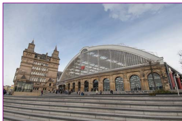
Estación de trenes de Liverpool